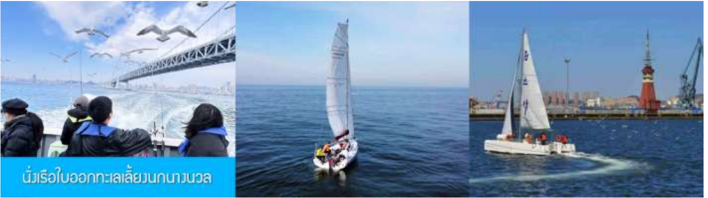
นั่งเรือใบออกทะเลลิ้นกวางนวล

ต่อด้วยนำท่านเที่ยวชมถนนรัสเซีย 俄罗斯风情街 ในอดีตที่นี่เป็นศูนย์ที่ตั้งของที่ทำการเมืองต้าเหลียน ภายหลังได้กลายเป็นชุมชนของพ่อค้าและวิศวกรทางรถไฟชาวรัสเซีย บริเวณนี้จึงเต็มไปด้วยอาคารบ้านเรือนแบบตะวันตก(รัสเซีย) มากมาย นอกจากนี้ได้เก็บภาพที่มีพื้นหลังเป็นอาคารสถาปัตยกรรมตะวันตก ที่นี้ยังมีร้านค้าที่จำหน่ายสินค้าและของที่ระลึกที่น่าเข้าจากรัสเซีย อาทิ ช็อกโกแลต เหล้าวอดก้า ตุ๊กตารัสเซีย ฯลฯ