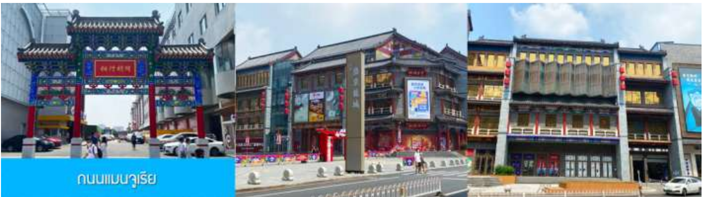
ถนนแมนจูเรีย