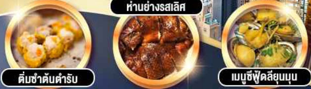
คัมซ่าต้นตำรับ ห่านย่างสลีส เมมูซี่ฟู้ดสลิมบุบ

การ์ตูนดี!! พักหรู 4 ดาว THE KOWLOON HOTEL ตึกถนนนาธาน ย่านช้อปปิ้งจิมซาจอย