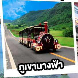
ภูเขาฉางฟ้า