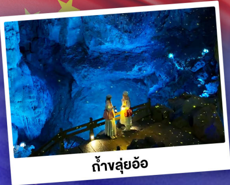
ถ้ำหลุย้อ

"ดินแดนแห่งสาขน้ำและภูเขา" สัมผัสประสบการณ์นั่งบอลลูนชมวิวมุมสูง