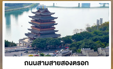
ถนนสามสายสองตรอก