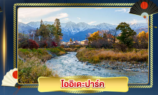
โออิเดะปาร์ค