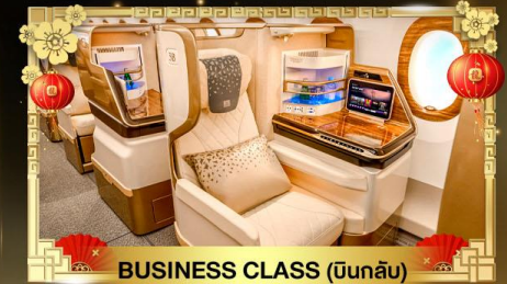
BUSINESS CLASS (บินกลับ)

🧳 น้ำหนักกระเป๋า 30Kg. ขาไป | 40Kg. ขากลับ