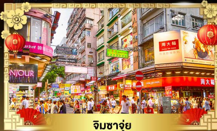
จิมซาจุ่ย