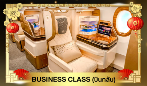
BUSINESS CLASS (บินกลับ)