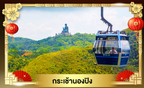
กระเช้านองปิง