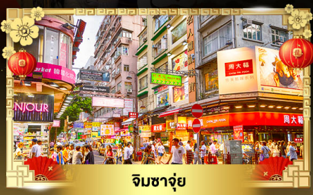
จิมซาจุ่ย