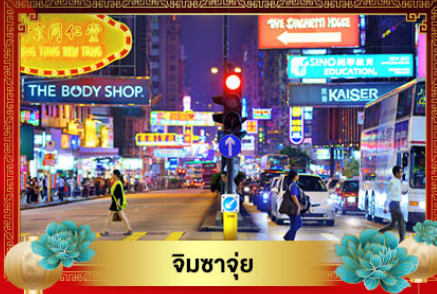
จิมซาจุ่ย