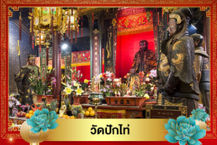
วัดปึกโท่