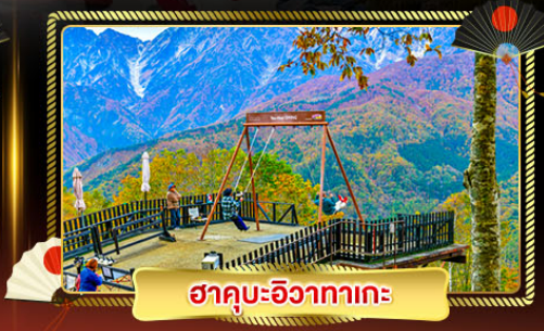
ฮาคุบะอิซากาตะ