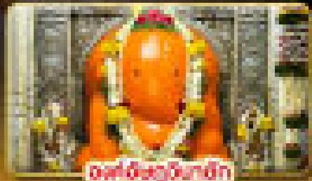
องค์สีส้มขาว