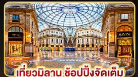
เที่ยวมิลาน ช้อปปิ้งจัดเต็ม