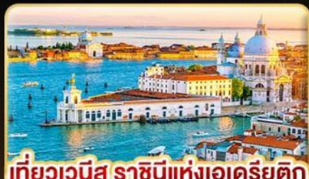
เที่ยวเวนิส ราชนิแห่งเอเดรียติก