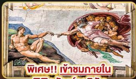
พิเศษ!! เข้าชมภายใน พิพิธภัณฑ์วาติกัน

เยือนประเทศต้นกำเนิด แห่งอารยธรรมยุโรป “อิตาลี”