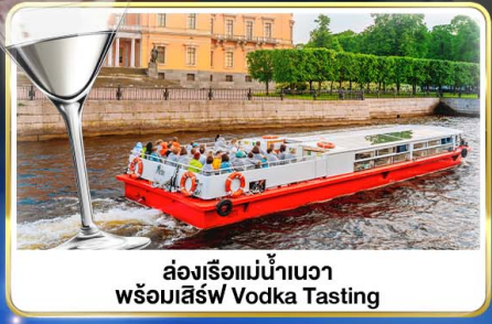
ส่งเรือแม่น้ำเนวา พร้อมเสิร์ฟ Vodka Tasting

📅 เดินทาง : 14-21 มิ.ย.69 / 28 มิ.ย.-05 ก.ค.69 / 24-31 ก.ค.69