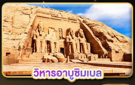
วิหารอาบูซิมเบล

น้ำหนักกระเป๋า 23Kg. (บินระหว่างประเทศ และบินภายใน)