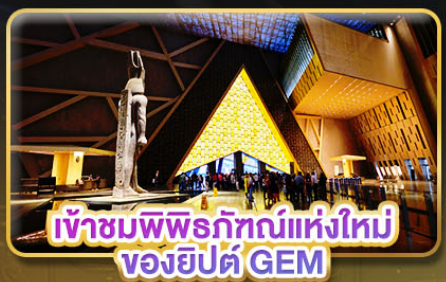
เข้าชมพิพิธภัณฑ์แห่งใหม่ ของอียิปต์ GEM