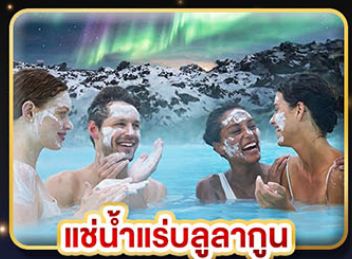
แช่น้ำแร่ลูลาทูน