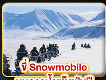
ขี่ Snowmobile บนธารน้ำแข็งพันปี