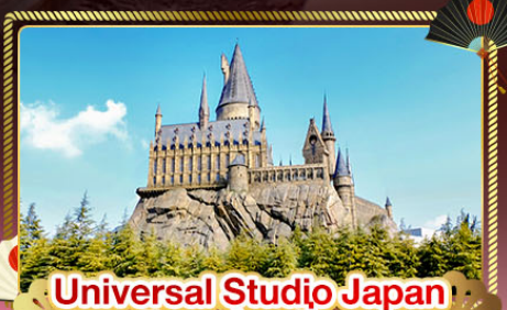
Universal Studio Japan (อิสระท่องเที่ยว)