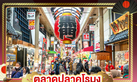
ตลาดปลาคุโรมง