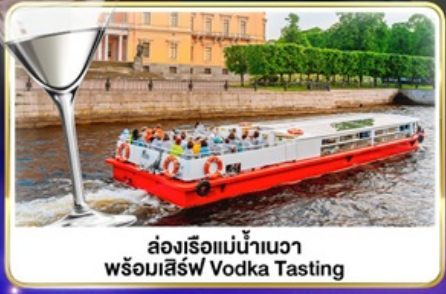
ล่องเรือแม่น้ำเนวา พร้อมเสิร์ฟ Vodka Tasting