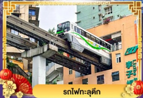
รถไฟฟ้า-ลู่ตีก