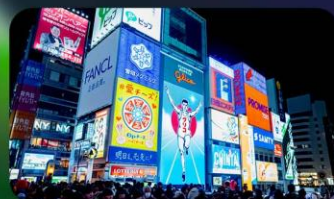
ซ้อปิ้งชินโซบาชิ