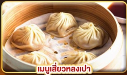
เมนูเสี่ยวหลงเปา

หมู่บ้านโบราณ จิวเฟิ่น ช้อปปิ้งจุใจ 3 ตลาดกลางคืนชื่อดัง