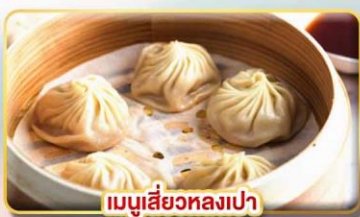
เมนูเสี่ยวหลงเปา