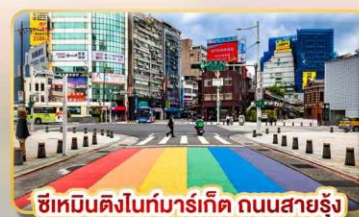
ซิเหมินตงไนท์มาร์เก็ต ถนนสายรุ้ง