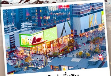
ถนนไท่กู๋หลี่หลิน