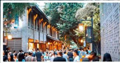
ถนนชอยกวั่งชอยแคว