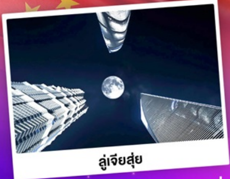
ดูเจียส่วย