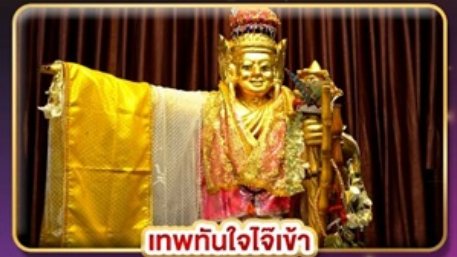
เทพทันใจจิเข้า