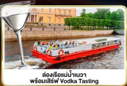
ส่องเรือแม่น้ำเนวา พร้อมเสิร์ฟ Vodka Tasting