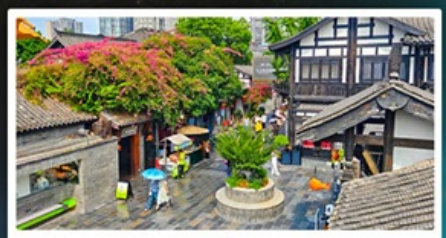
ถนนชอยกว้างชอยแคว