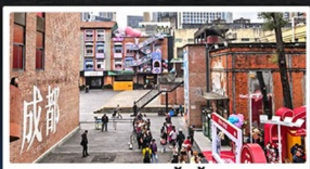
ตงเจียวจ้ออี้