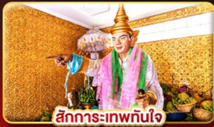
สิทธิการ:เทพทันใจ