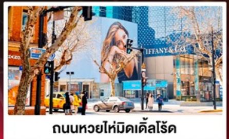
ถนนหวยไห่มีดเคิลโรด