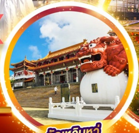
วัดหัวหน่วง