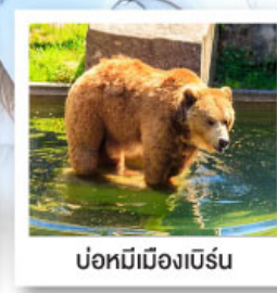
บ่อหมีเมืองเบิร์น