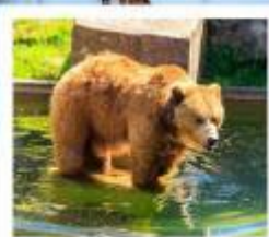
บ่อหมีเมืองเบิร์น