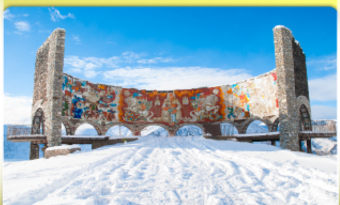
อนุสรณ์สถานรัสเซีย