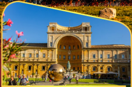
เข้าชมพีพีรภัณฑวาทิกัน