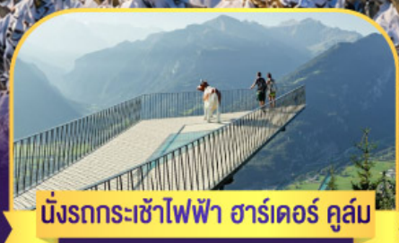
นั่งรถกระเช้าไฟฟ้า ชาร์เตอร์ คูส์ม