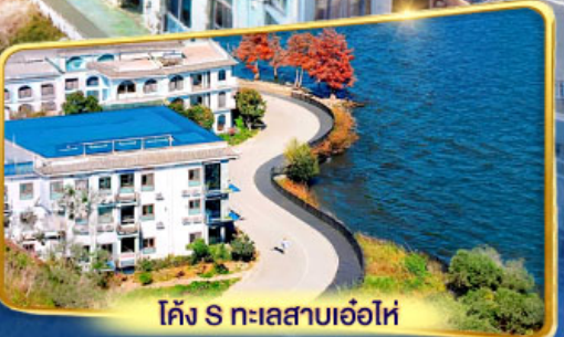
โค้ง S ทะเลสาบเอ๋อไห่