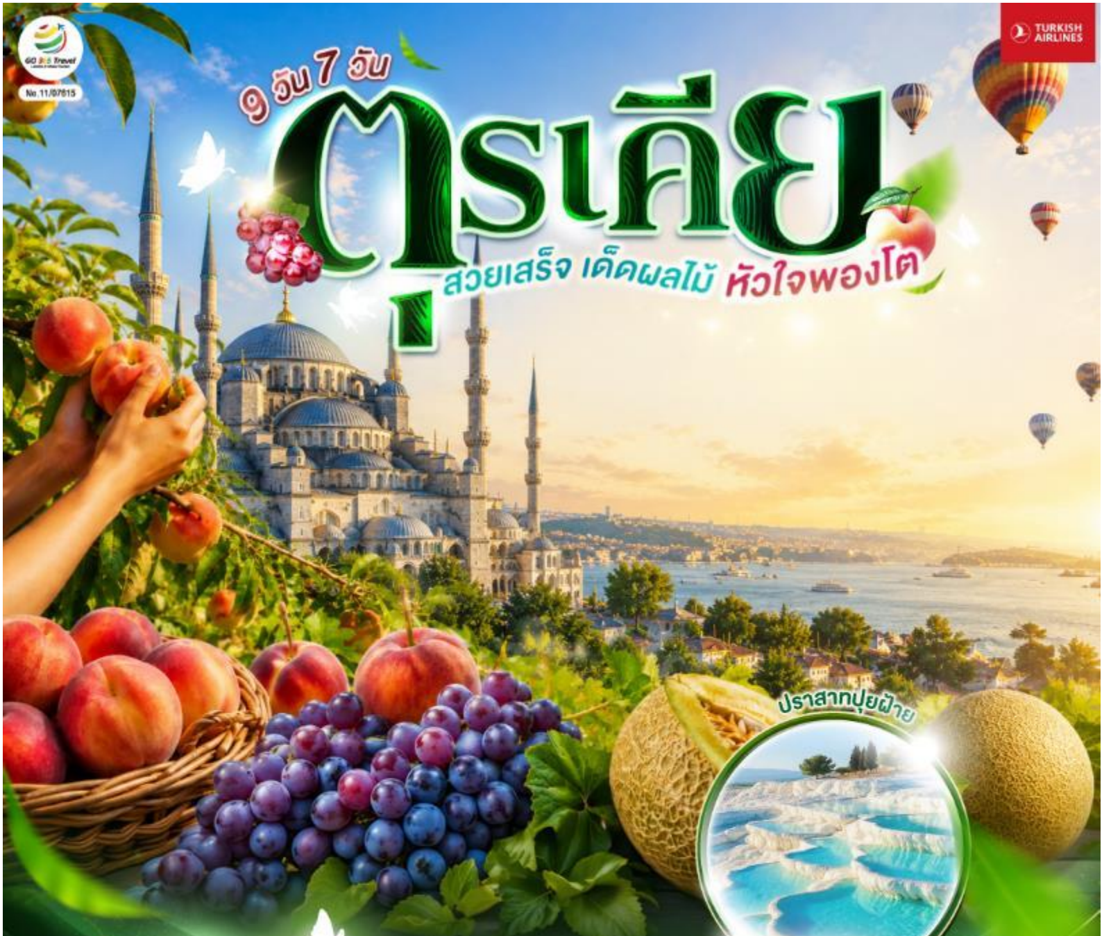
ปราสาทปูยฝ้าย