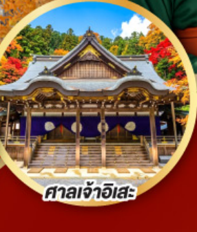
ศาลเจ้าอิสะ