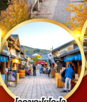
โคมะคะโยโคะโจ