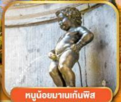
หุมน้อยมาเนเกินพิส