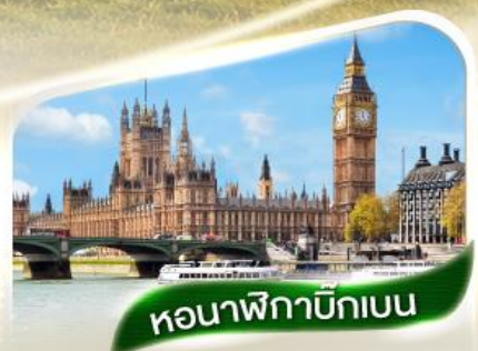
หอนาฬิกาบิกเบน