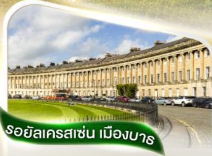
รอยัลคราซซัน เมืองบาร