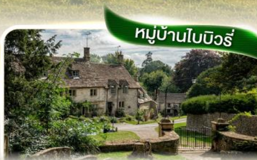
หมู่บ้านไบบิวรี่