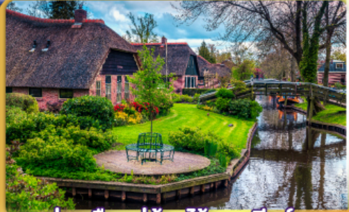
ล่องเรือหมู่บ้านไรทอนนทีธูร์น