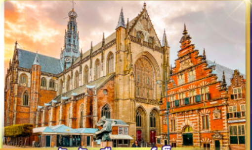
จัตุรัสเมืองฮาร์ลิม

พรมแดนเมืองแปลกเนเธอร์แลนด์และเบลเยียม เติมนเมืองเคลฟท์ เมืองเครื่องปั้นดินเผาระดับโลก ฮาร์ลิมเมืองมั่งคั่งที่สุดของเนเธอร์แลนด์