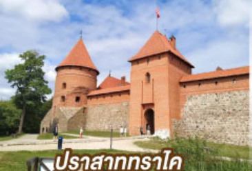
ปราสาททราไค