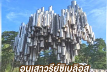
อนุสาวรีย์ซีเบลึอุส