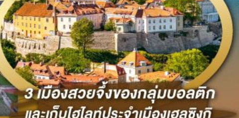
3 เมืองสวยจิ้งของกลุ่มบอลติก และเก็บไฮไลท์ประจำเมืองเฮลซิงกิ และล่องเรือเฟอร์รี่ข้ามประเทศ

ไฮไลท์ในโปรแกรม • เที่ยวสามประเทศหลักกลุ่มบอลติก • ชมเมืองหลวงวิลนิอุส ประเทศลิทัวเนีย