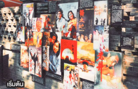
เริ่มต้น