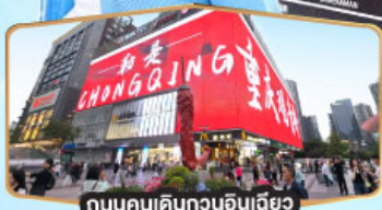
ถนนคนเดินทงยวนเฉียว