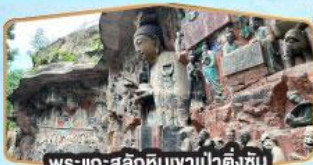
พระแกะสลักหินเขาป่าตึงซัน