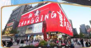
ถนนคนเดินถวณอันเฉียว