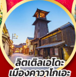
ลิตเติลเอโดะ เมืองคาวาโกเอะ