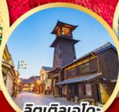
ลิตเติลเอโดะ เมืองควาโกเอะ