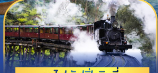
รถไฟฟฟิงบิลลี่

ล่องเรือชมอ่าวซิดนีย์พร้อมรับประทานอาหารกลางวัน และ เข้าชมสวนสัตว์การองก้า