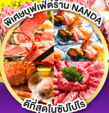
พิศขุมบุฟเฟ่ต์ร้าน NANDA