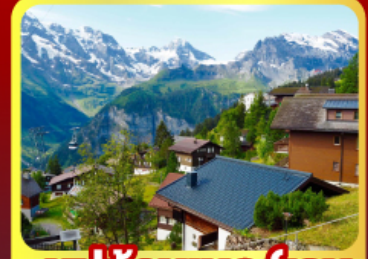
หมูบ้านเมอร์เรน