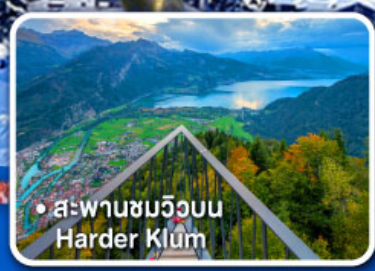
• สะพานชมวิวยอบบ Harder Klum