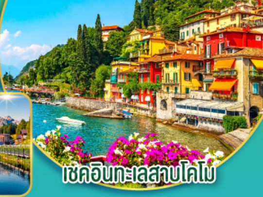
เชคอินทะเลสาบโคโม