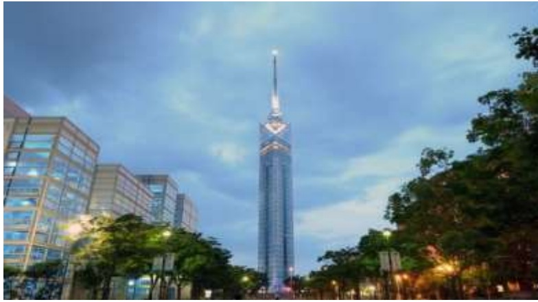
Fukuoka Tower หอคอยตึกทะเลที่สูงที่สุดในประเทศญี่ปุ่นถึง 234 เมตร

สถานที่ท่องเที่ยวที่ได้รับความนิยมมากที่สุดในฟูกูโอกะ: