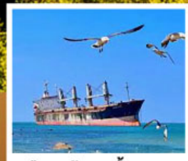
เรือสินค้าเกย์ตันบลูวิส