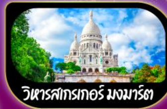
วิหารสกรเทอร์ มงมาร์ต