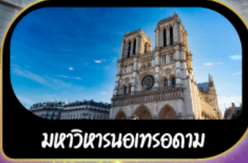
มหาวิหารนอทรอดาม