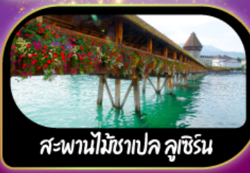
สะพานไม้ฆาปค คูชีริน