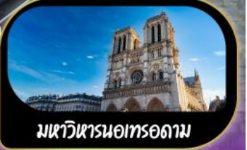
มหาวิหารนอทรอดาม