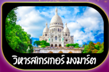
วิหารสกรเกอร์ มงมาร์ต