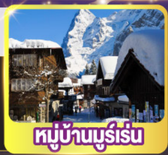
หมู่บ้านมูร์เร็น