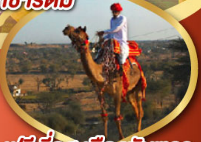
ฟรี ทั้จู่จู่ เมืองมันทวา ราคาเริ่มต้น